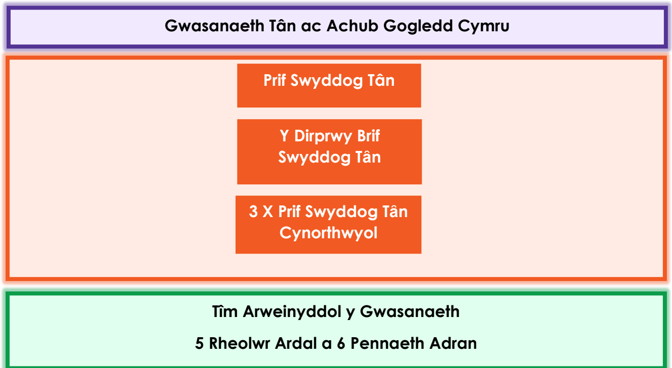
Ffig 3. Strwythur Arweinyddiaeth y Gwasanaeth

Mae Strwythur Llywodraethu a Sicrwydd y Gwasanaeth, sef y pwyllgorau a'r grwpiau, sy'n adrodd i Dîm Arweinyddol y Gwasanaeth, wedi'i ymgorffori ar draws y sefydliad, gan ddangos bod y llywodraethu yn gadarn o ran adrodd, monitro, craffu a gwneud penderfyniadau ym mhob rhan o'r sefydliad.