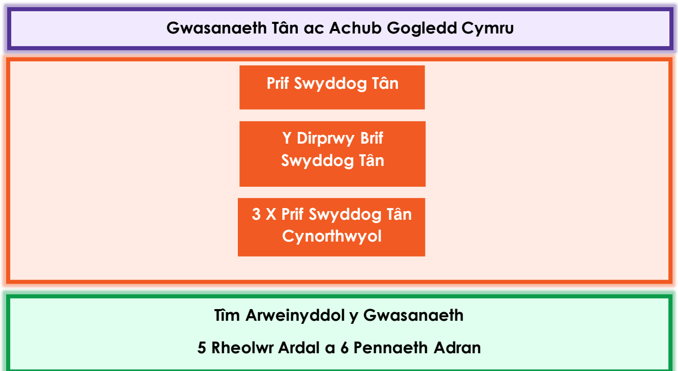
Ffig 3. Strwythur Arweinyddiaeth y Gwasanaeth

Mae Strwythur Llywodraethu a Sicrwydd y Gwasanaeth, sef y pwyllgorau a'r grwpiau, sy'n adrodd i Dîm Arweinyddol y Gwasanaeth, wedi'i ymgorffori ar draws y sefydliad, gan ddangos bod y llywodraethu yn gadarn o ran adrodd, monitro, craffu a gwneud penderfyniadau ym mhob rhan o'r sefydliad.