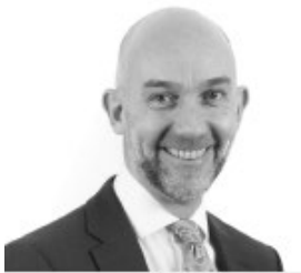
Adrian Crompton Archwilydd Cyffredinol Cymru

Mae hefyd yn nodi fy ffi archwilio amcangyfrifedig, manylion fy nhîm archwilio a dyddiadau allweddol ar gyfer cyflawni gweithgareddau ac allbynnau arfaethedig fy nhîm archwilio.